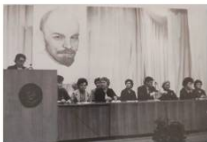
Заседание профсоюза работников образования 1986 год