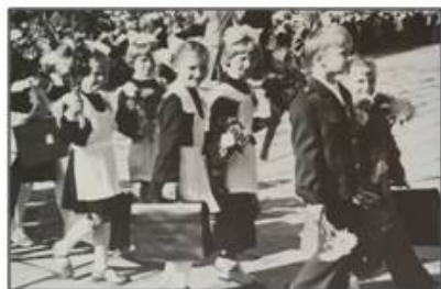
Новоселье в средней школе №70 города Тольятти. 1 сентября 1986 года