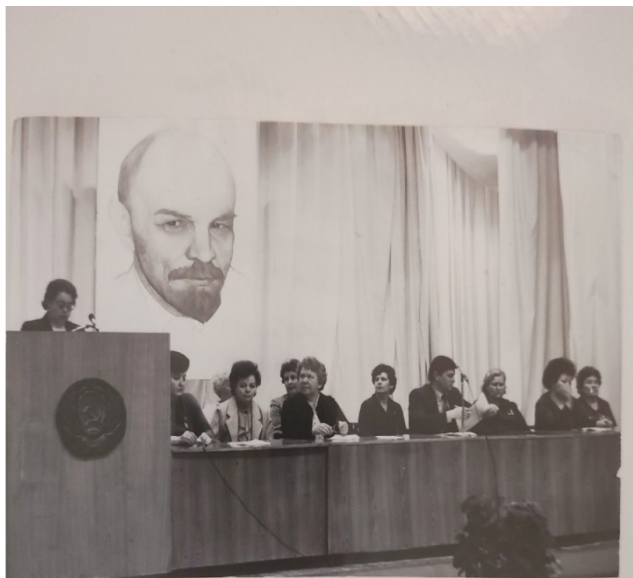
Профсоюзная конференция 1986 г