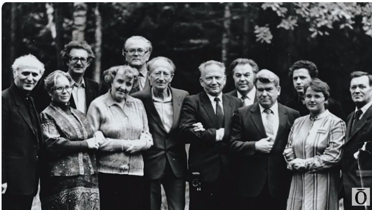
Педагоги при написании манифеста «Педагогика сотрудничества», 1986 год.