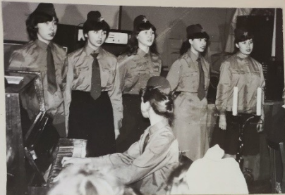
Огидбригада „Задор“ сш 50

В районе работает 2 315 кружков по интересам. В них занято 57 890 уч-ся. Силами родителей и шефов организовано 223 кружка. В них занято 2 676 уч.