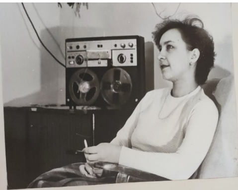
Созданы кабинеты эмоциональной разгрузки сш. 31, 38, 34, 49.