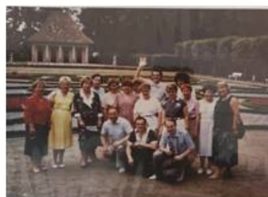
Делегация работников образования и культуры города Тольятти в периоде побратиме Вольсбург, ФРГ, 1990

«Учительство было настроено на перемены, и это еще одна особенность, потому что все остальные реформы навязывались сверху».