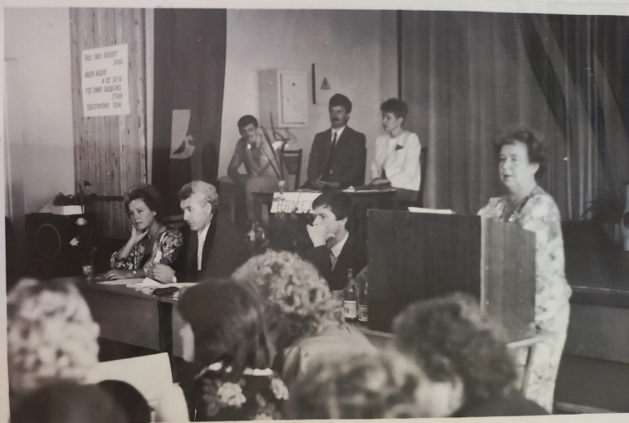
Совещание директоров школ Автозаводского района 1990 г.