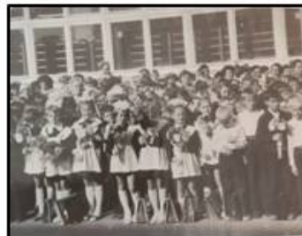
Ливейга. 1 сентября 1986 года

Готовы к новому учебному году на 1 июля без ремонта средние школы: 37, 42, 43, 44, 48, 49, 50, 51, 57.