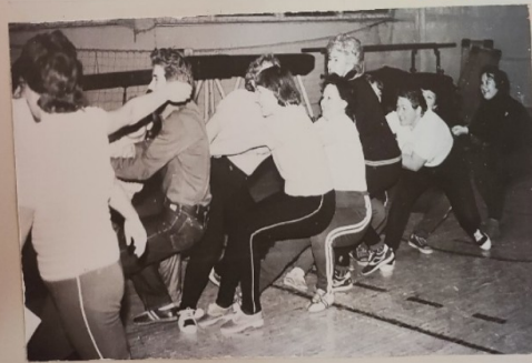
Работают группы здоровья сш 35 Кто победит? Спортивные соревнования сш 48

шефы сш 32 Управление Централизованного обслуживания и ремонта оборудования КВЦ ВАЗа. Оборудовано 15 рабочих мест в цехах для учащихся 9-10 х классов в школьных мастерских по договору с базовым предприятием изготовлено: