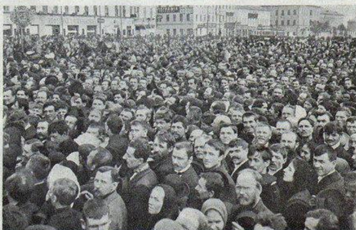
Толпа трезвенниковъ на Сухаревой площади.