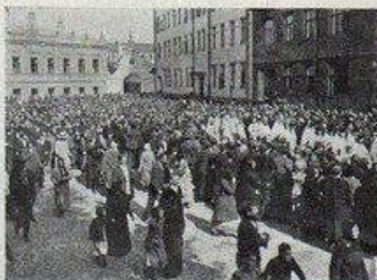
День трезвости въ Москвѣ. Крестный ходъ.

29-е августа было днѣмъ трезвости. Повсемѣстно во всѣхъ церквяхъ Россійской Имперіи были совершены торжественныя богослуженія съ молебствіемъ по особому чину «объ удержаніи народа пьянственнаго» и произведенъ кружечный сборъ на борьбу съ пьянствомъ.