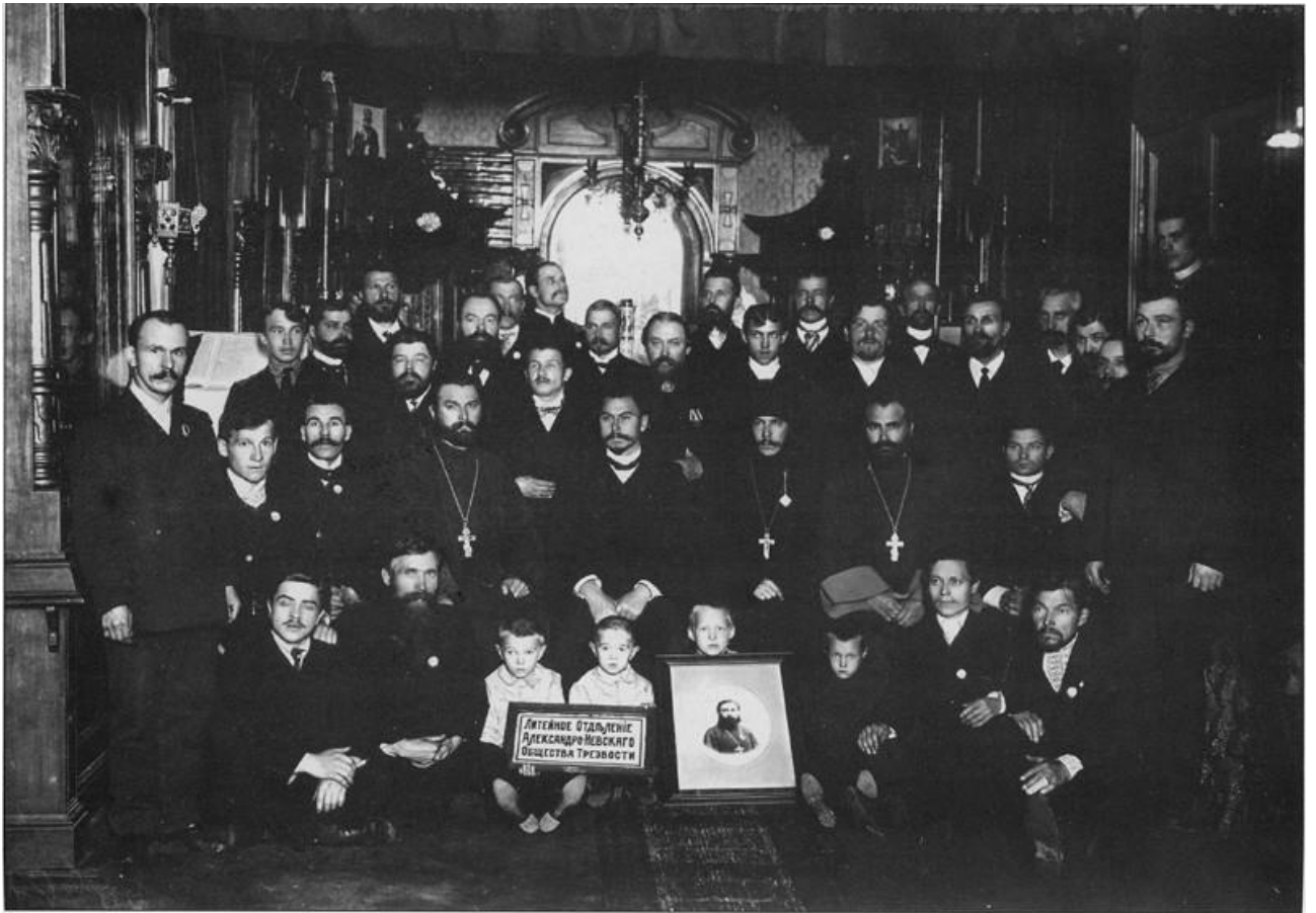
Александрo-Невское общество трезвости при Воскресенской церкви «Общества распространения религиозно-нравственного просвещения в духе православной церкви». Группа членов Литейного отделения. 1900-е г.