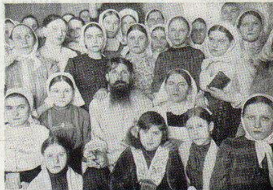
Собраніе женщинъ-трезвенницъ, устроенное прислужкой на кухнѣ съ разрѣшенія ея барыни.