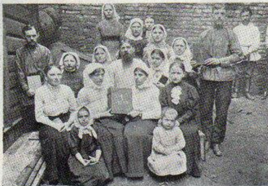
Группа петербургскихъ трезвенниковъ послѣ молитвеннаго собранія.

трезвенниковъ, послѣдователей Чурикова. Время отъ времени группы ихъ собираются въ разныхъ частныхъ столовыхъ для чтенія евангелія и бесѣдъ и гдѣнйа религиозно-нравственныхъ диссерт.