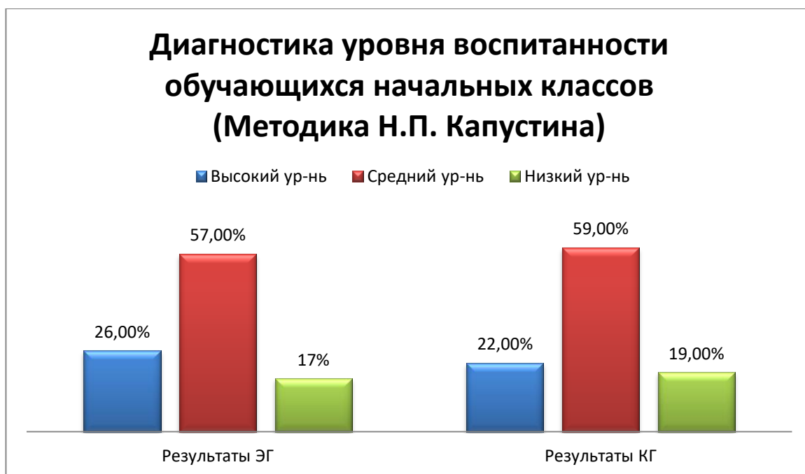
Рис.5. Результаты диагностики уровня воспитанности обучающихся начальных классов (Методика Н.П. Капустина) ЭГ и КГ в процентном соотношении.

перед коллективом, незначительный уровень коммуникативности). Результаты представлены на рис.5.