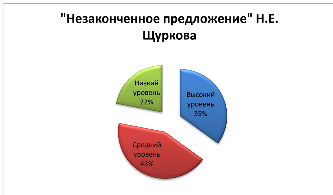
Рис. 1. Результаты диагностики уровня сформированности когнитивного компонента в ЭГ на констатирующем этапе эксперимента.

Описание процедуры: после ознакомления с процедурой проведения данной методики у детей не возникло никаких вопросов. Большинство из них выполнили его легко и быстро. Затруднительным было для испытуемых дать общее понятие Родины и малой Родины. Большинство знают, какая страна и город к этому относятся, но не понимают, как описать что это. Наглядно результаты тестирования в ЭГ можно наблюдать на рис. 1.