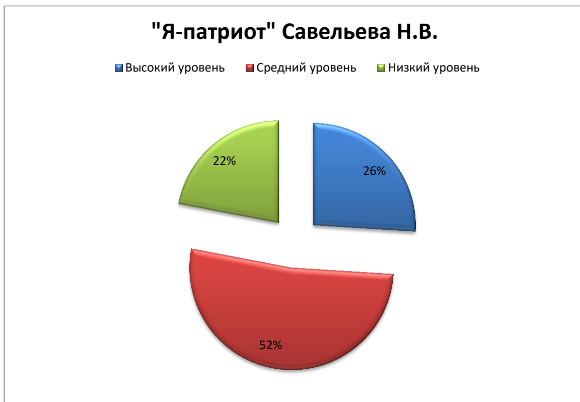
Рис. 3. Результаты диагностики уровня патриотической воспитанности по мотивационно-потребностному и поведенческо-волевому критериям в ЭГ.

Количественные результаты диагностики уровня патриотической воспитанности по мотивационно-потребностному и поведенческо-волевому критериям Савельевой Н.В. «Я-патриот» в ЭГ представлены в таблице 3. Наглядно результаты тестирования в ЭГ можно наблюдать на рис. 3.