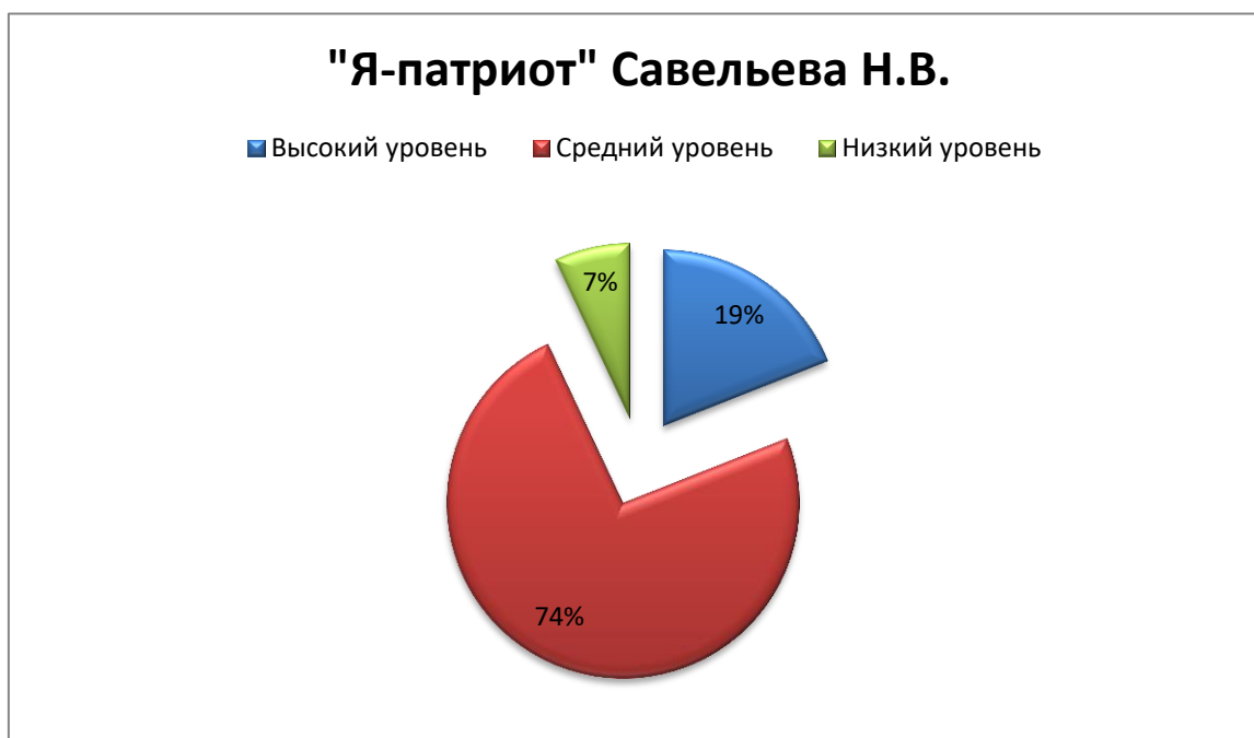
Рис. 4. Результаты диагностики уровня патриотической воспитанности по мотивационно-потребностному и поведенческо-волевому критериям в КГ.

Данные результаты свидетельствуют о том, что в КГ испытуемых преобладает средний уровень - 20 человек (74%). Высокий уровень в КГ составляет 5 (19%) опрошенных. Низкий уровень – 2 человека (7%) .