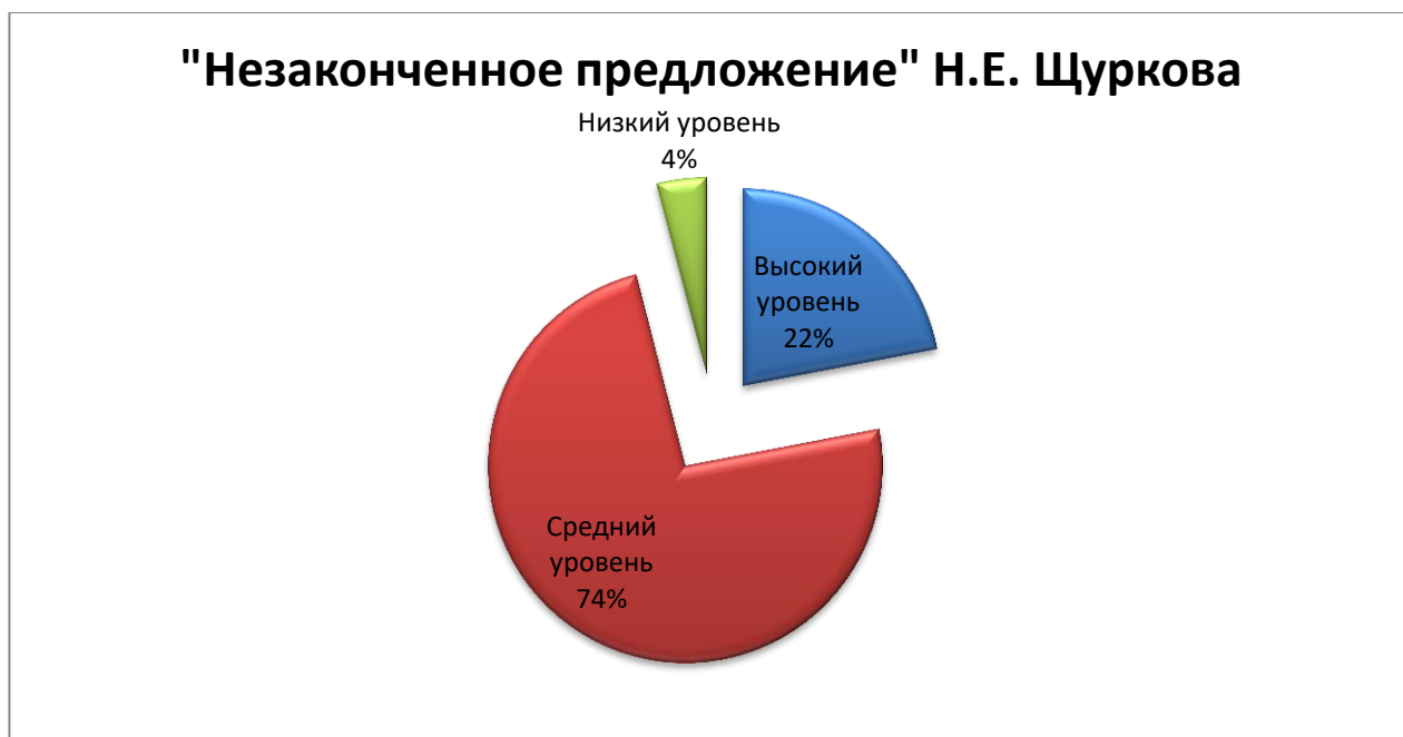
Рис. 2. Результаты диагностики уровня сформированности когнитивного компонента в контрольной группе на констатирующем этапе эксперимента.

Результаты диагностики в КГ показали следующее: 20 обучающихся (74%) имеют средний уровень сформированности когнитивного компонента, высоким уровнем обладают 6 человек (22%) в классе и 1 (4%) показал результаты, соответствующие низкому уровню.