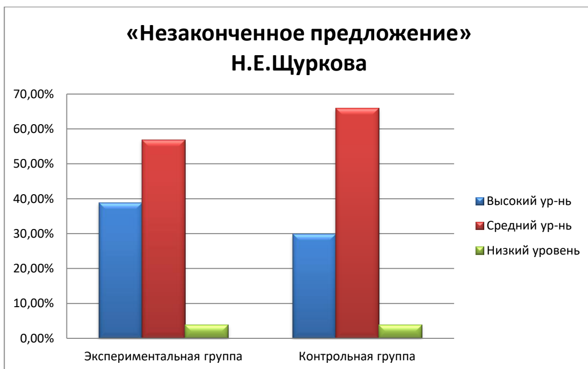
Рис.6. Результат диагностики уровня сформированности когнитивного компонента в ЭГ и КГ на контрольном этапе эксперимента.