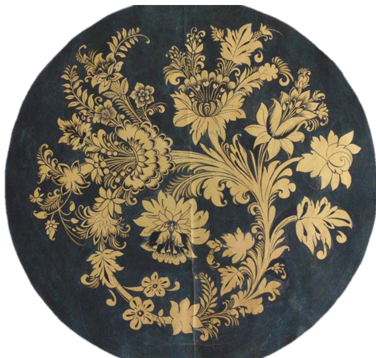
Рис 1. Хохломская роспись в технике Кудрина