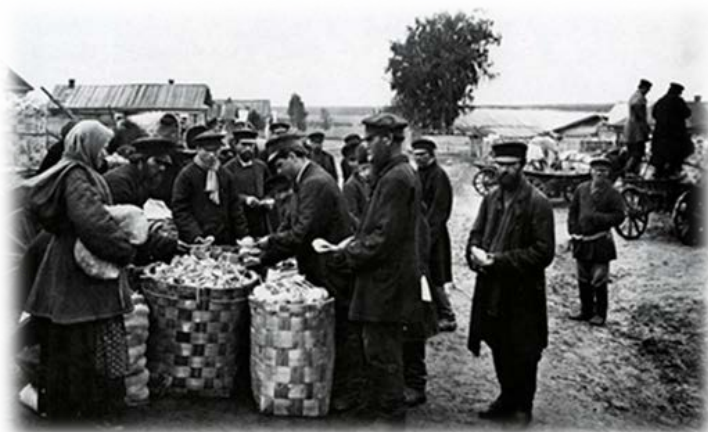
Рис 1. Ложкарный базар в г. Семенов. 1897г