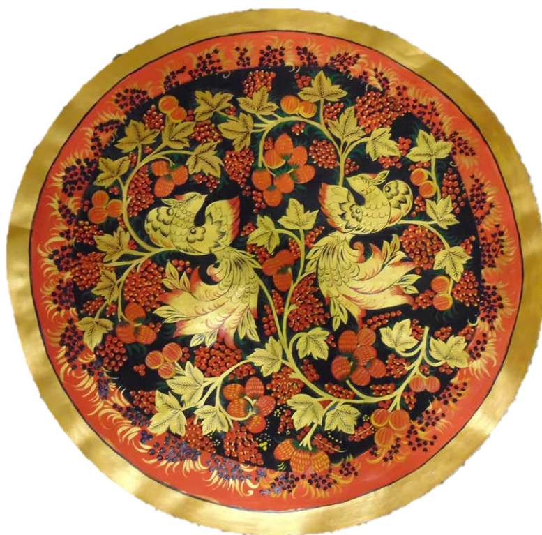
Рис 6. Итоговый эскиз в технике «Под фон»