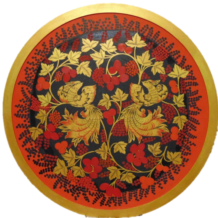
Рис 5. Прорисовка мелких деталей на птицах и листьях. Добавление первого слоя ягод (крыжовник, клубника, красная и чёрная смородина, брусника)