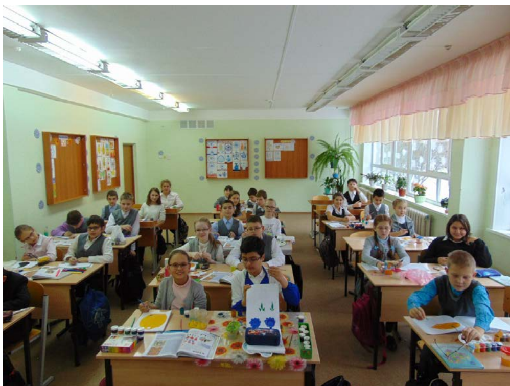
Рис 2. Процесс работы над хохломской росписью учениками 5 Б класса