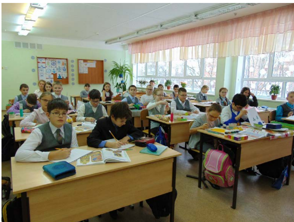
Рис 1. Учащиеся 5 Б класса на уроке изобразительного урока. Ход работы