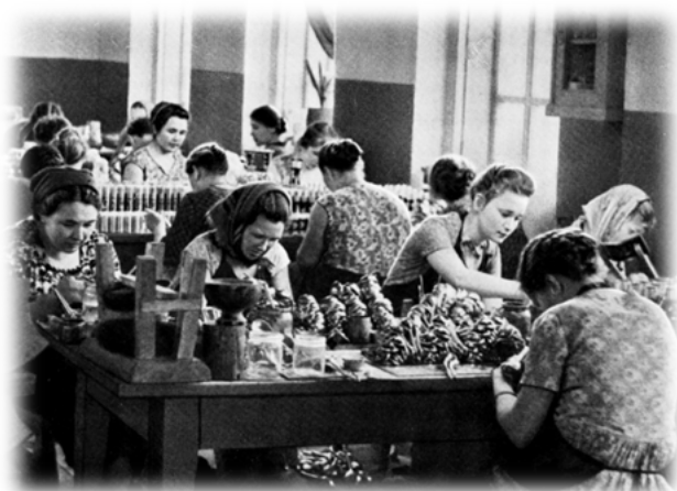
Рис 2. В цехе художественной росписи г. Семенов, СССР