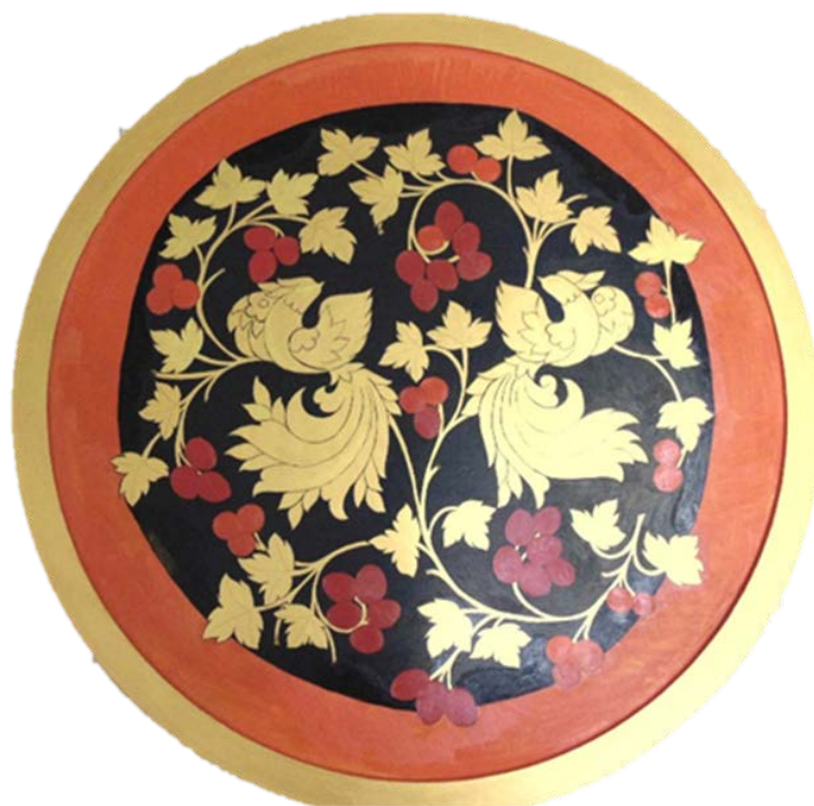
Рис 4. Заливка двух видов фона в 2 слоя масляными красками марс чёрный и кадмий красный светлый