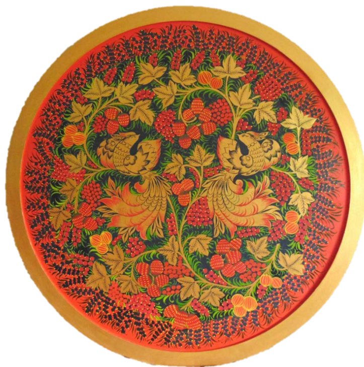
Рис 7. Добавление двух видов «травки» масляными красками травяной зелёной и светло-зелёной