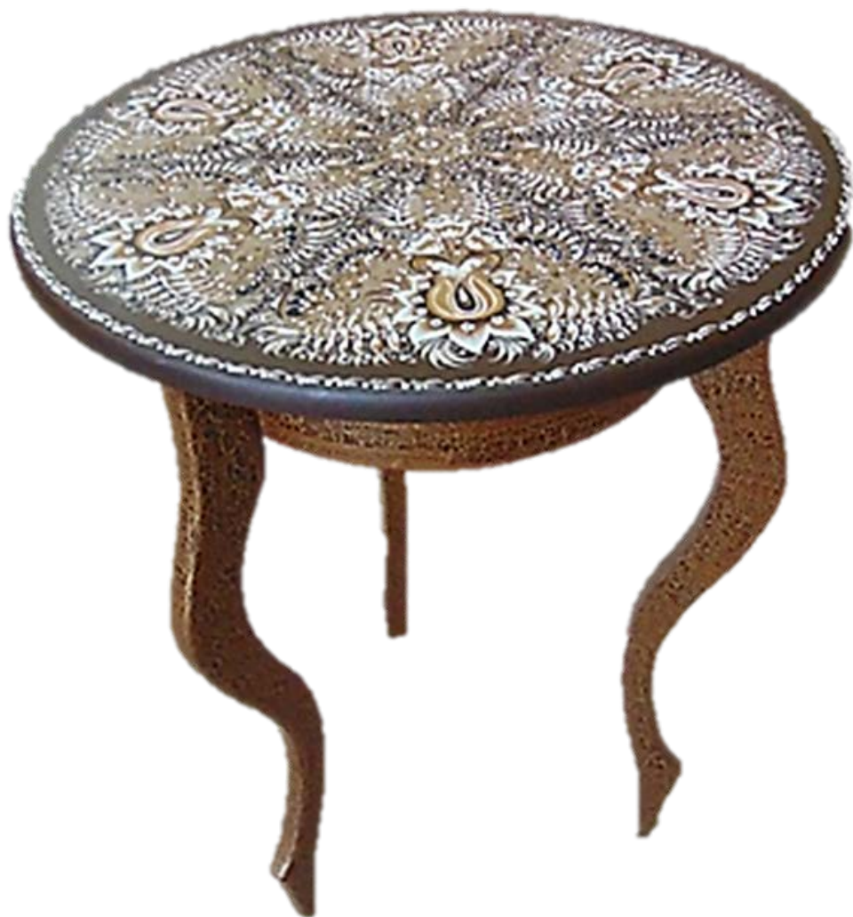
Рис 5. Шаронова Н.Н. Журнальный столик, 2015 г