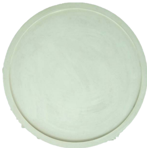
Рис 1. Грунтовка изделия в 2 слоя и прошкуривание до ровной поверхности