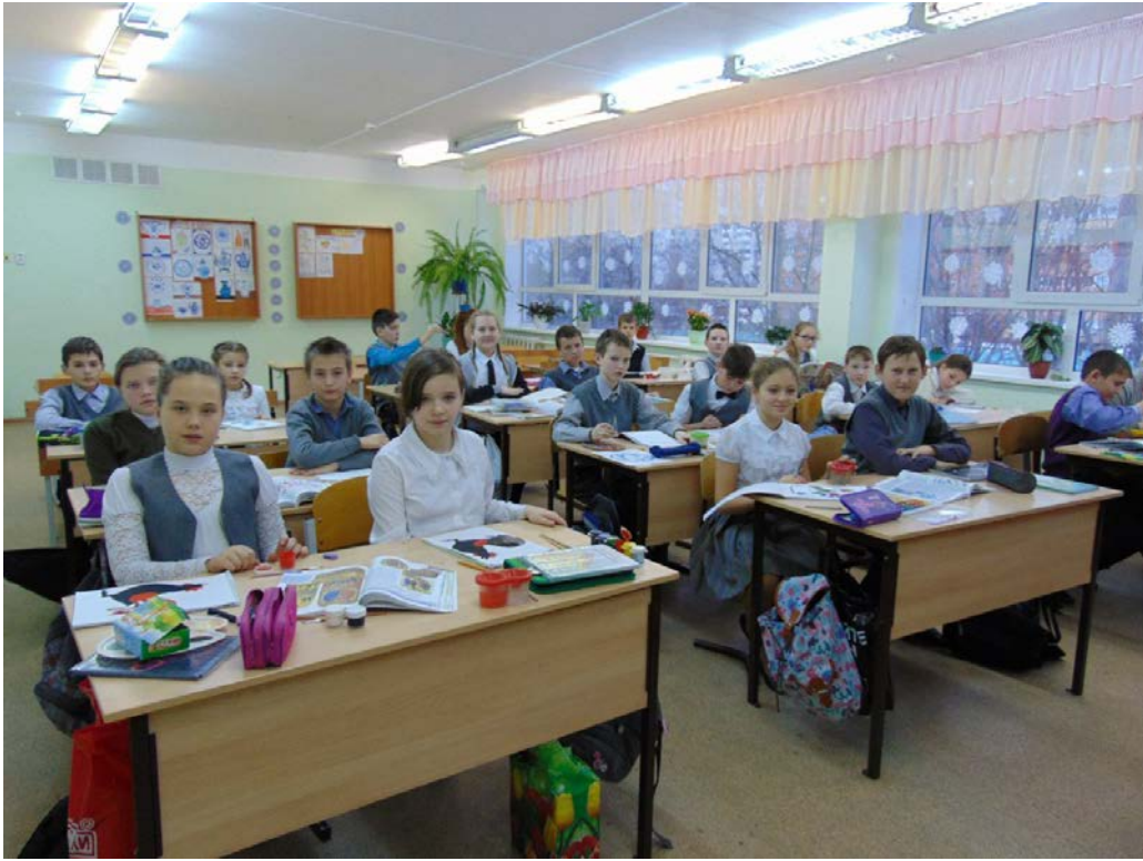
Рис 3. Изучение хохломской росписи учениками 5 Г класса