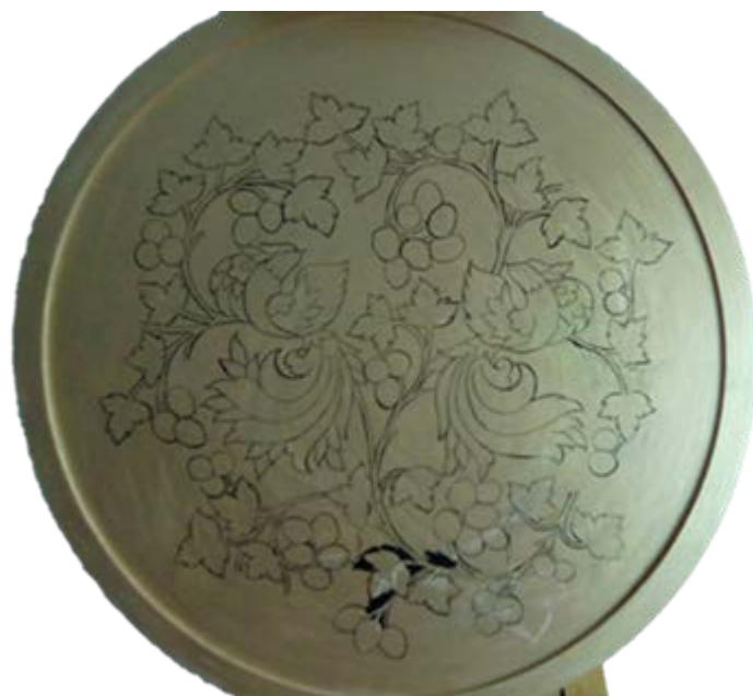
Рис 3. Нанесение рисунка на панно через копировальную бумагу и обводка контура рисунка тонкой кисточкой чёрным цветом