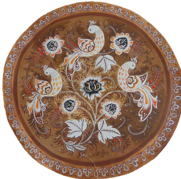
Рис 4. Хохломская роспись в технике «Под фон»