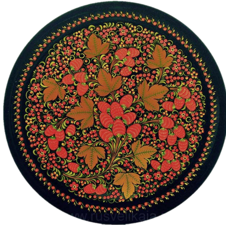
Рис 3. Хохломская роспись в технике «Под фон»