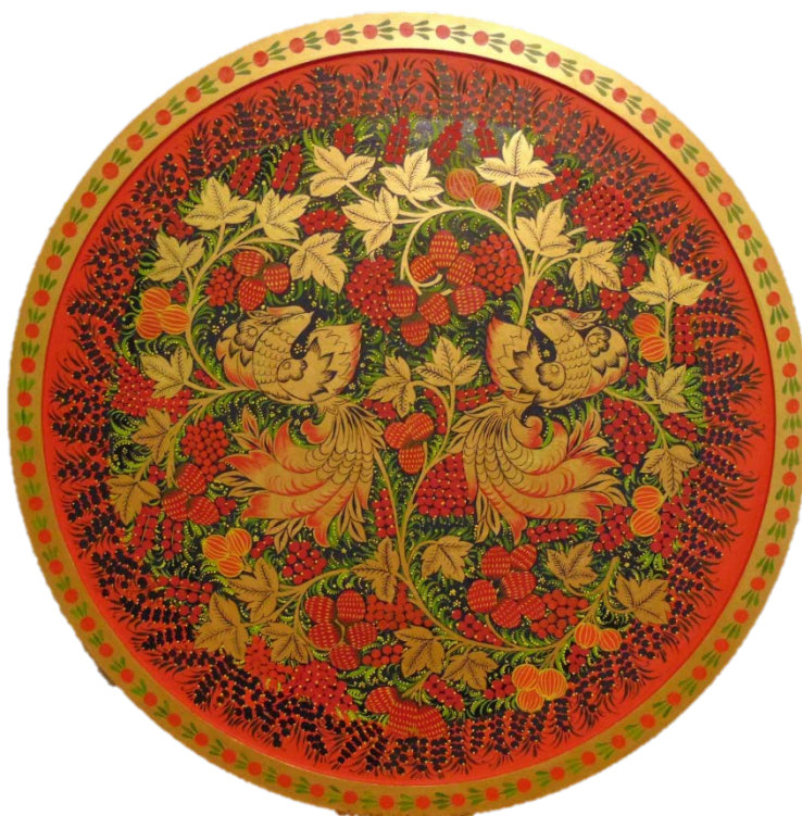
Рис 8. Роспись каймы, добавление мелких деталей на панно. Покрытие лаком