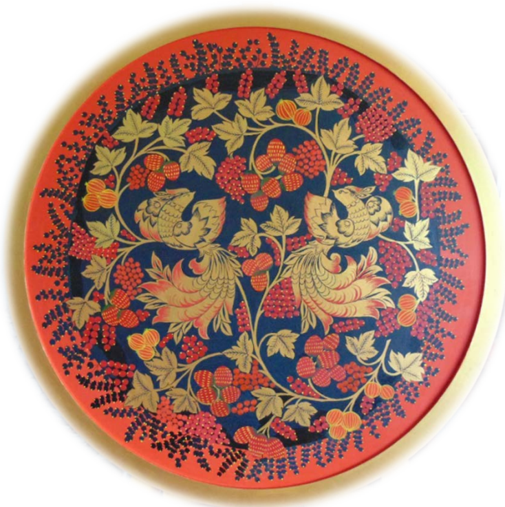
Рис 6. Добавление второго слоя на ягодах и разживка