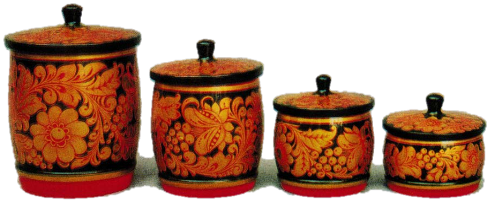
Рис 3. А. П. Кузнецова. «Набор поставцы». 1969