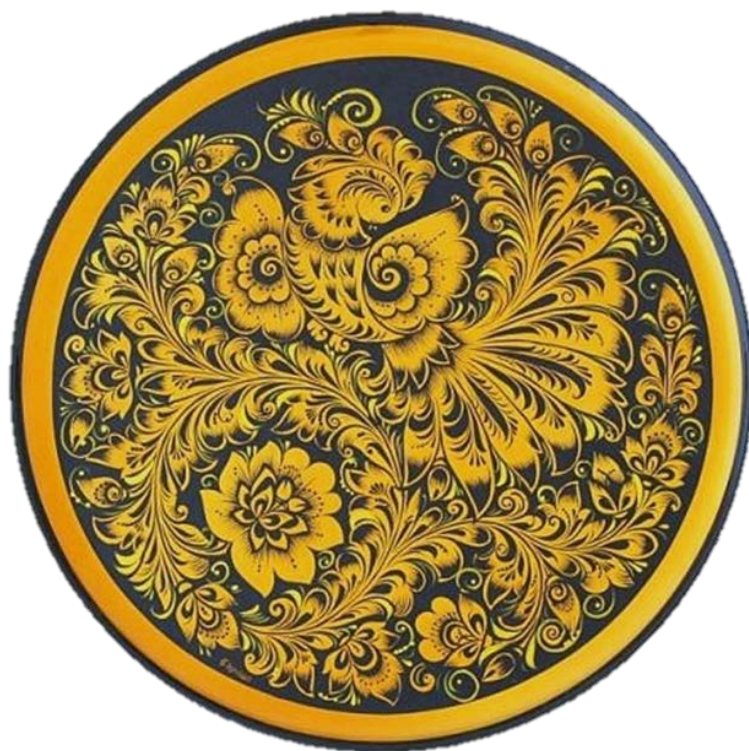
Рис 2. Хохломская роспись в технике Кудрина