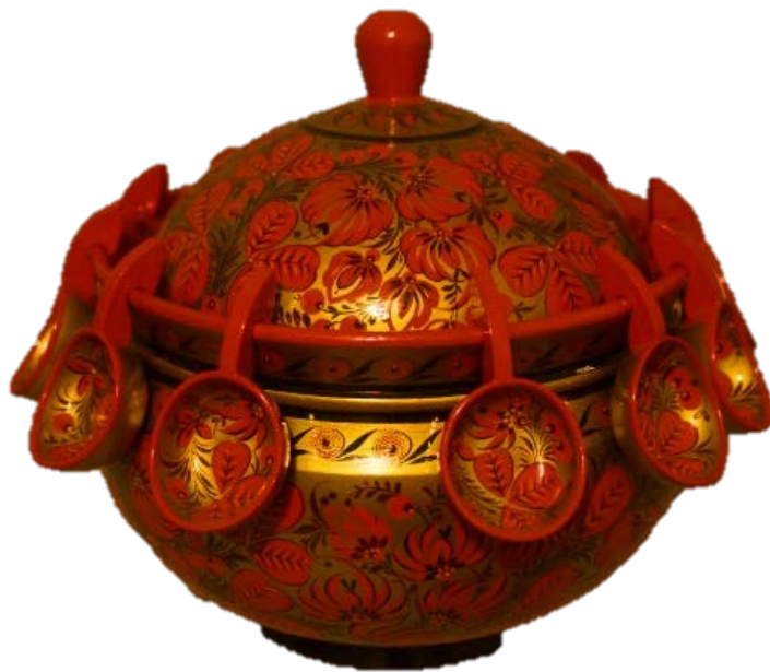
Рис 4. Н.А.Гущин. Набор «Супница с деревянными ложками» 2016г.