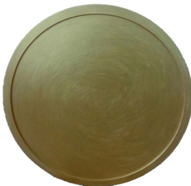
Рис 2. Покрытие изделия золотой акриловой краской металлик в 2 слоя