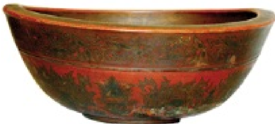
Рис 2. Ф.Ф. Красильников «Чаша с хохломой кудрина» (1896 г)