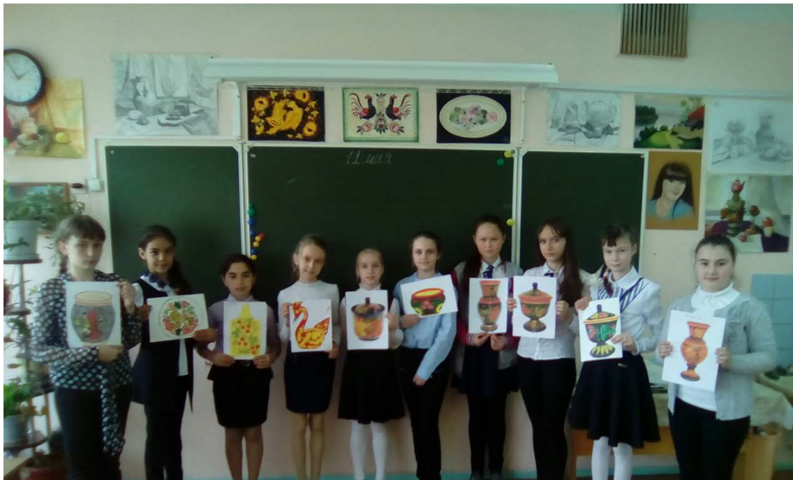
Рис 10. Выставка рисунков с хохломской росписью учениками 5-х классов внеучебной деятельности