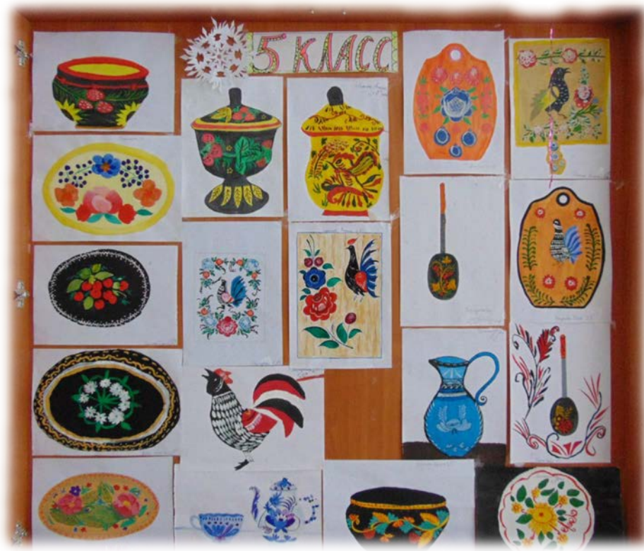
Рис 4. Выставка лучших детских работ на тему Русские народные промыслы