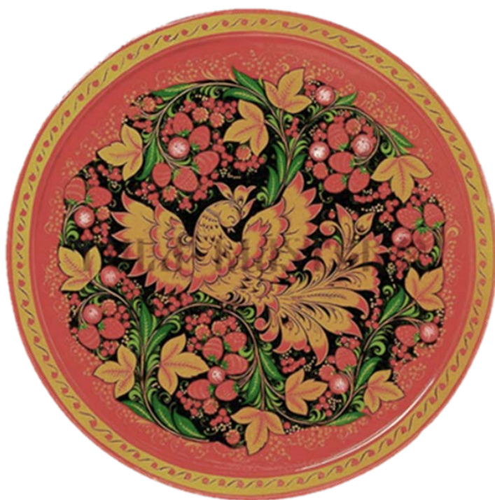
Рис 5. Хохломская роспись в технике «Под фон»