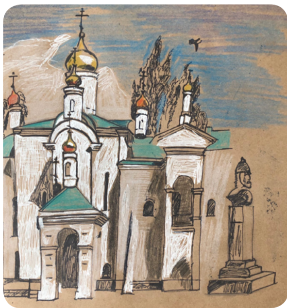
Алена Ларкина, направление "Изобразительное искусство"

Лицензия 90101 № 0008025 от 14 июля 2014 года (бессрочно) Свидетельство о государственной аккредитации № 2589 от 16 мая 2017 года (срок действия до 16 мая 2023 г.)